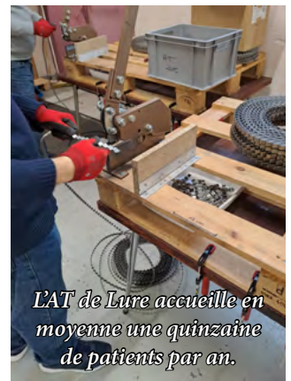
L'AT de Lure accueille en moyenne une quinzaine de patients par an.

L'ensemble des processus d'élaboration est réalisé sous l'œil bienveillant mais vigilant des professionnels qui restent disponibles et à l'écoute pour accompagner les patients dans les missions qui leur sont confiées et peuvent ainsi évaluer leurs ressources personnelles qui sont à maximiser. « Nous constatons également l'entraide entre les patients, ce sont des petites victoires du quotidien qui apportent une satisfaction collective » relate l'équipe.