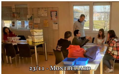
23/11 - MONTBÉLIARD