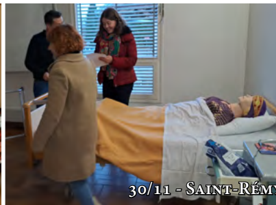
30/11 - SAINT-RÉMY-EN-COMTÉ