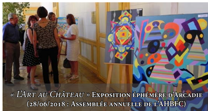
« L'ART AU CHÂTEAU » EXPOSITION ÉPHÉMÈRE D'ARCADIE (28/06/2018 : ASSEMBLÉE ANNUELLE DE L'AHBFC)

Cet emplacement, à l'accueil du siège historique de l'AHBFC, offre également davantage de visibilité à Arcadie, vecteur d'expression et de déstigmatisation des usagers, en accord avec notre projet institutionnel.