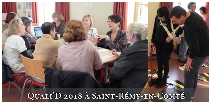
QUALI'D 2018 À SAINT-RÉMY-EN-COMTÉ

5 nouveaux ateliers pédagogiques et interactifs seront ainsi proposés sur 3 des principaux sites de l'établissement - à Saint-Rémy-en-Comté, Pierre Engel à Bavilliers et Jean Messagier à Montbéliard - à l'occasion des Quali'D organisées par la cellule qualité grâce à l'implication de différents services (voir encadré ci-contre).