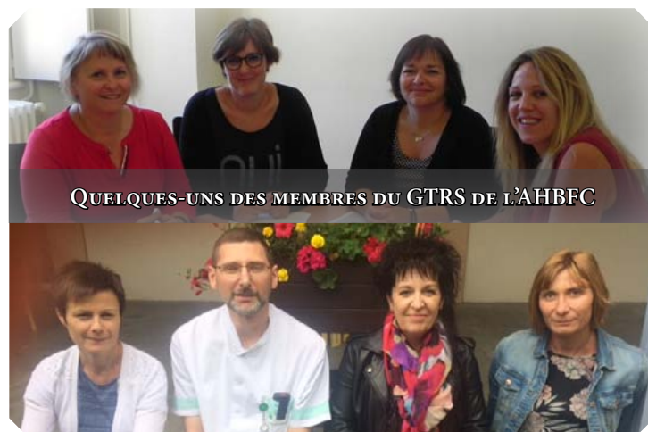
QUELQUES-UNS DES MEMBRES DU GTRS DE L'AHBFC

Plus d'informations ainsi que les coordonnées de contact pour un projet de recherche en soins sont disponibles sur intranet (DSI).