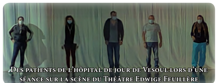
DES PATIENTS DE L'HÔPITAL DE JOUR DE VESOUL LORS D'UNE SÉANCE SUR LA SCÈNE DU THÉÂTRE EDWIGE FEUILLÈRE

« Je ne connaissais pas le théâtre comme thérapie [...] j'ai découvert le plaisir d'être un peu moi-même [...] nous avons beaucoup ri sans aucun jugement » relate une patiente ; un succès confirmé par les mots utilisés par les autres participants pour décrire leurs ressentis : « relâchement, évocation, tranquillité, joie, thérapeutique, lâcher-prise, déconnection... »