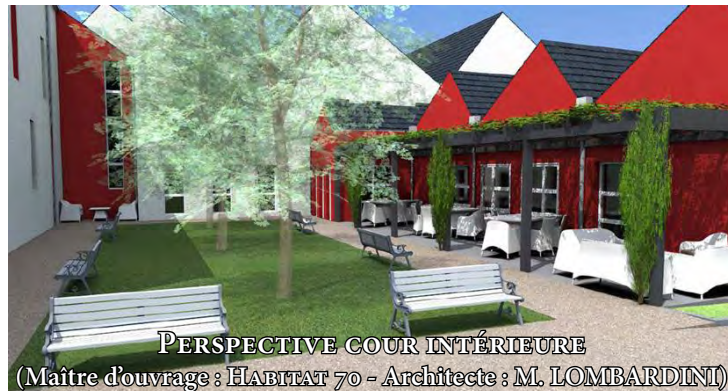
PERSPECTIVE COUR INTÉRIEURE (Maître d'ouvrage : HABITAT 70 - Architecte : M. LOMBARDINI)

Implantée dans un environnement composé du panel de réponses que l'AHBFC déploie déjà tout au long du parcours de soins (centre médico-psychologique, service d'accompagnement à la vie sociale, groupe d'entraide mutuelle...), la structure proposera un accompagnement individualisé des bénéficiaires vers leur projet de vie.