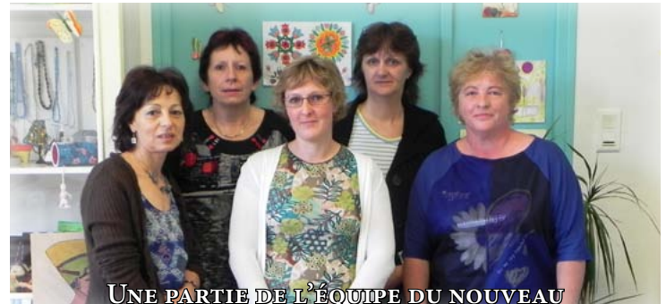
UNE PARTIE DE L'ÉQUIPE DU NOUVEAU PÔLE ERGOTHÉRAPIE