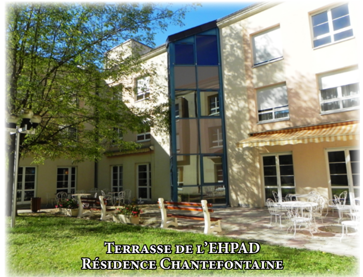
TERRASSE DE L'EHPAD RÉSIDENCE CHANTEFONTAINE

Outre ces 2 places temporaires, l'établissement, géré par l'AHBFC, accueille 80 résidents au sein de ses différentes unités de vie.