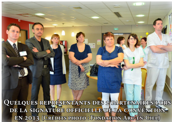
QUELQUES REPRÉSENTANTS DES 2 PARTENAIRES LORS DE LA SIGNATURE OFFICIELLE DE LA CONVENTION EN 2013