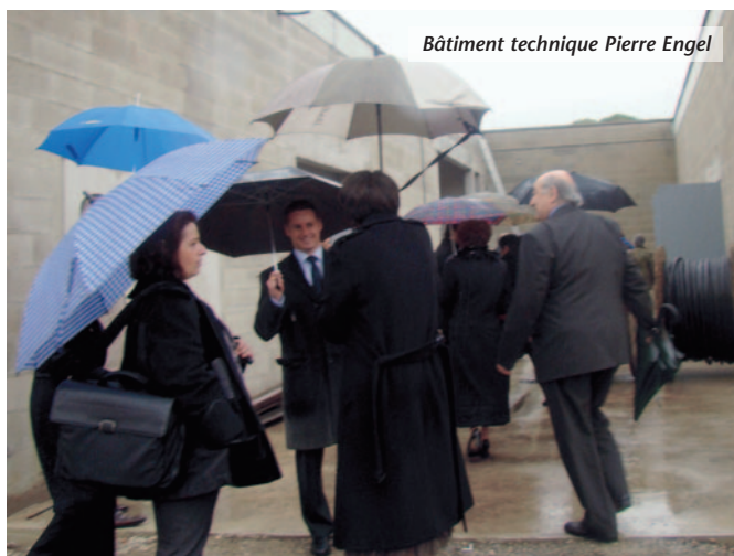
Bâtiment technique Pierre Engel